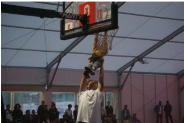
Sélection de photos réalisées par Alice BOUVET.