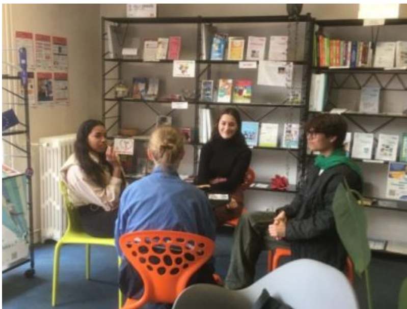
Mercredi des langues.