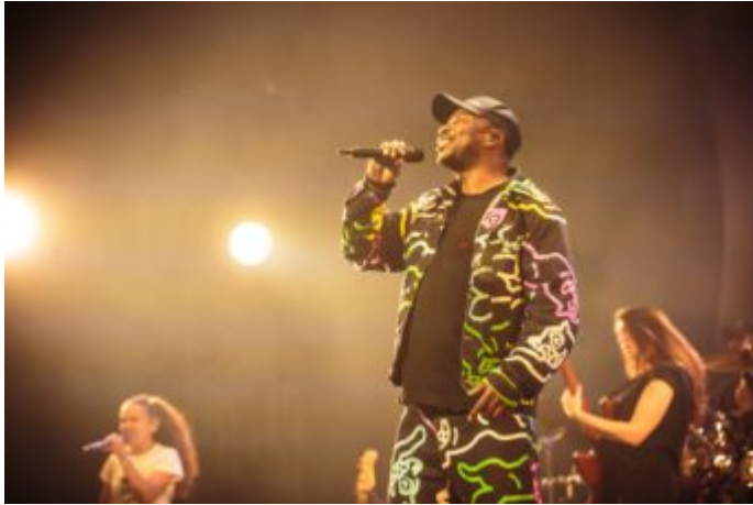
MC Solaar (Crédit photos : Antoine Monegier du Sorbier).