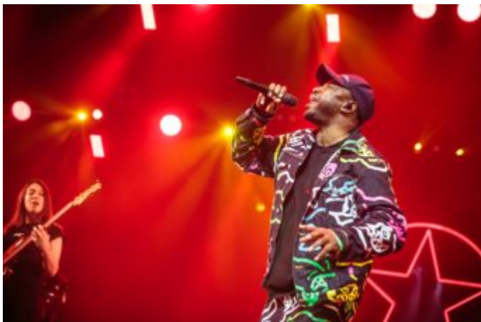
MC Solaar.