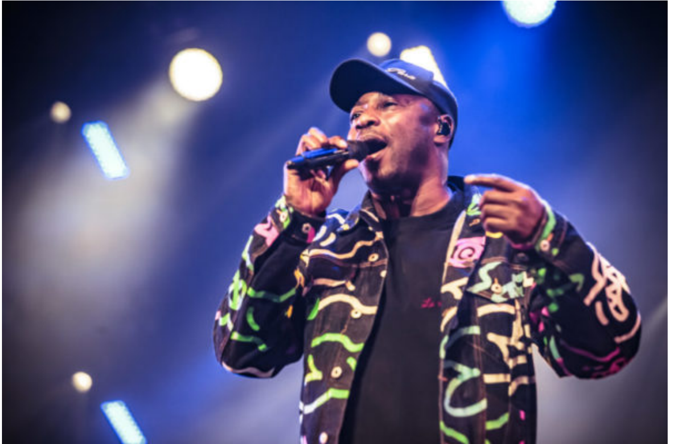
MC Solaar (Crédit photos : Antoine Monegier du Sorbier).