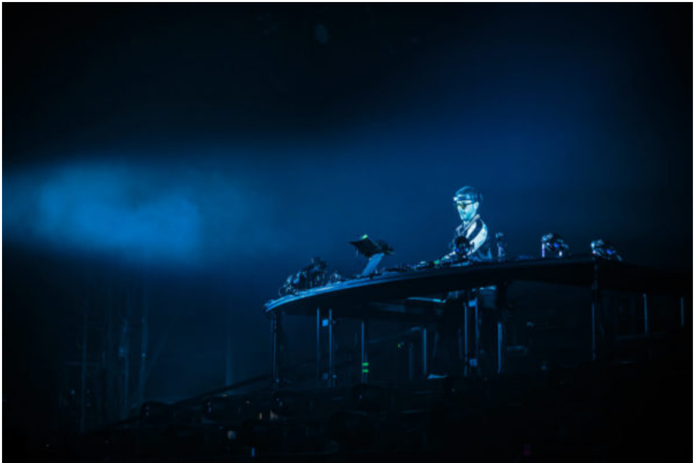
The Avener (Crédit photos : Antoine Monegier du Sorbier).

Le W a été transformé en piste de danse avec le show flamboyant de The Avener . L'orfèvre de l'électro a transcendé des festivaliers avec son répertoire aux sonorités multiples et sa mise en scène immersive. The Avener a laissé les commandes à une figure emblématique de la scène électronique : Fat Boy Slim .