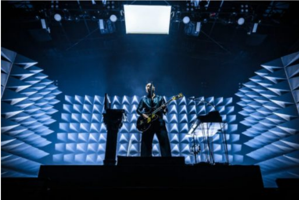
Yodelice (Antoine Monegier du Sorbier).