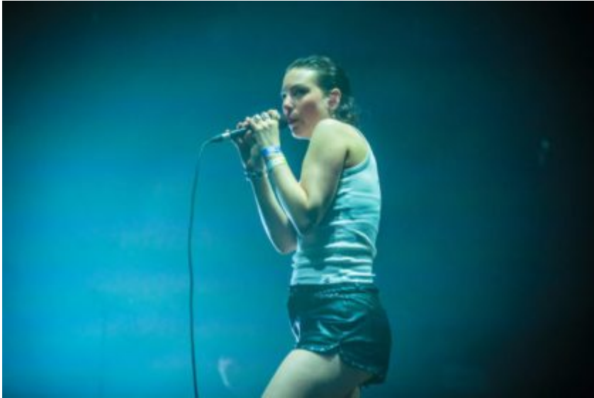
Adé (Crédit photos : Antoine Monegier du Sorbier).

« Une nouvelle génération d'artistes, de Dalí à Theodora en passant par Piche ou Gwendoline s'est illustrée, confirmant la volonté du Printemps à mettre en lumière les talents de demain » (L'équipe du festival)