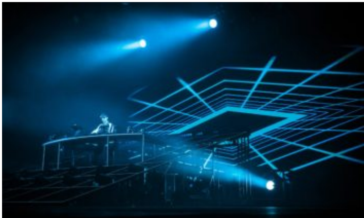
The Avenir (Crédit photos : Antoine Monegier du Sorbier).