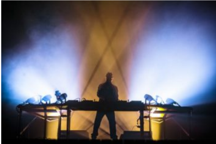
The Avenir (Crédit photos : Antoine Monegier du Sorbier).