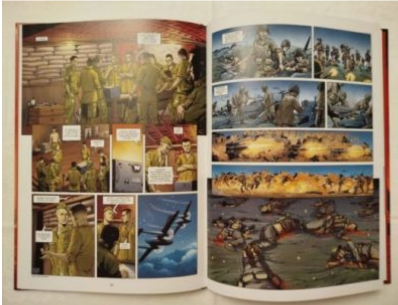
« Le chirurgien de Diên Biên Phu » Page 40