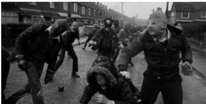
Photo du conflit nord-irlandais

Enfin, la série met brillamment en lumière les conflits géopolitiques qui opposent les états dominants aux états dominés. Ici, l'Irlande, clairement marginalisée, tente de résister tant bien que mal à l'oppression avec la mise en place de l'IRA. Toujours en quête de véracité, la production dépeint les méthodes et la dérive radicale de cette armée , guidée d'une main de fer par Gerry Adams, un homme politique aux controverses multiples et aux mensonges éhontés qui a pourtant toujours nié toute implication dans cette organisation.