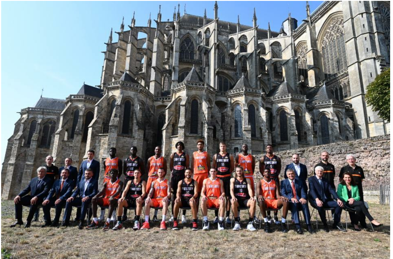
La formation du MSB 2020-2021 a posé pour la photo officielle au pied de la Cathédrale Saint-Julien.