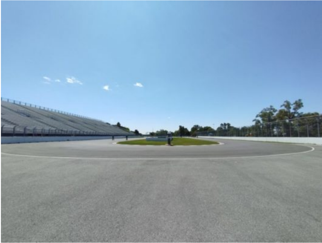
Le circuit Gilles Villeneuve