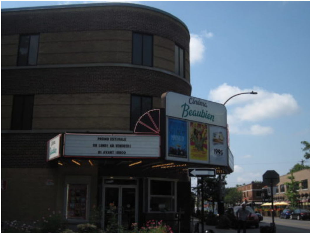
Le cinéma Baubien, un des cinémas art et essai de Montréal

En prévision de la rentrée, j'ai également fait un tour du campus de l'Université de Montréal , où je vais étudier cette année. Par son apparence et son immensité, il est difficile de ne pas penser à un décor de film nord-américain. L'université est en effet si étendue qu'elle est desservie par trois stations de métro !