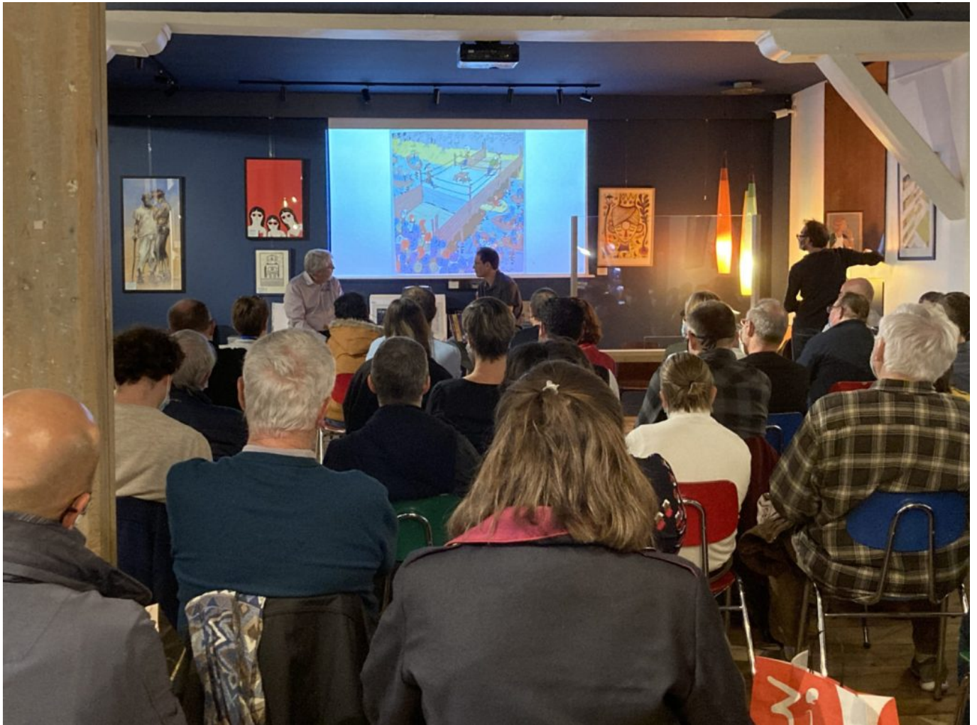
Le dessinateur Achdé était invité au Mans, à la Librairie Bulle, le vendredi 23 octobre 2020.

Un cow-boy dans le coton, 48 pages (éditions Lucky Comics).