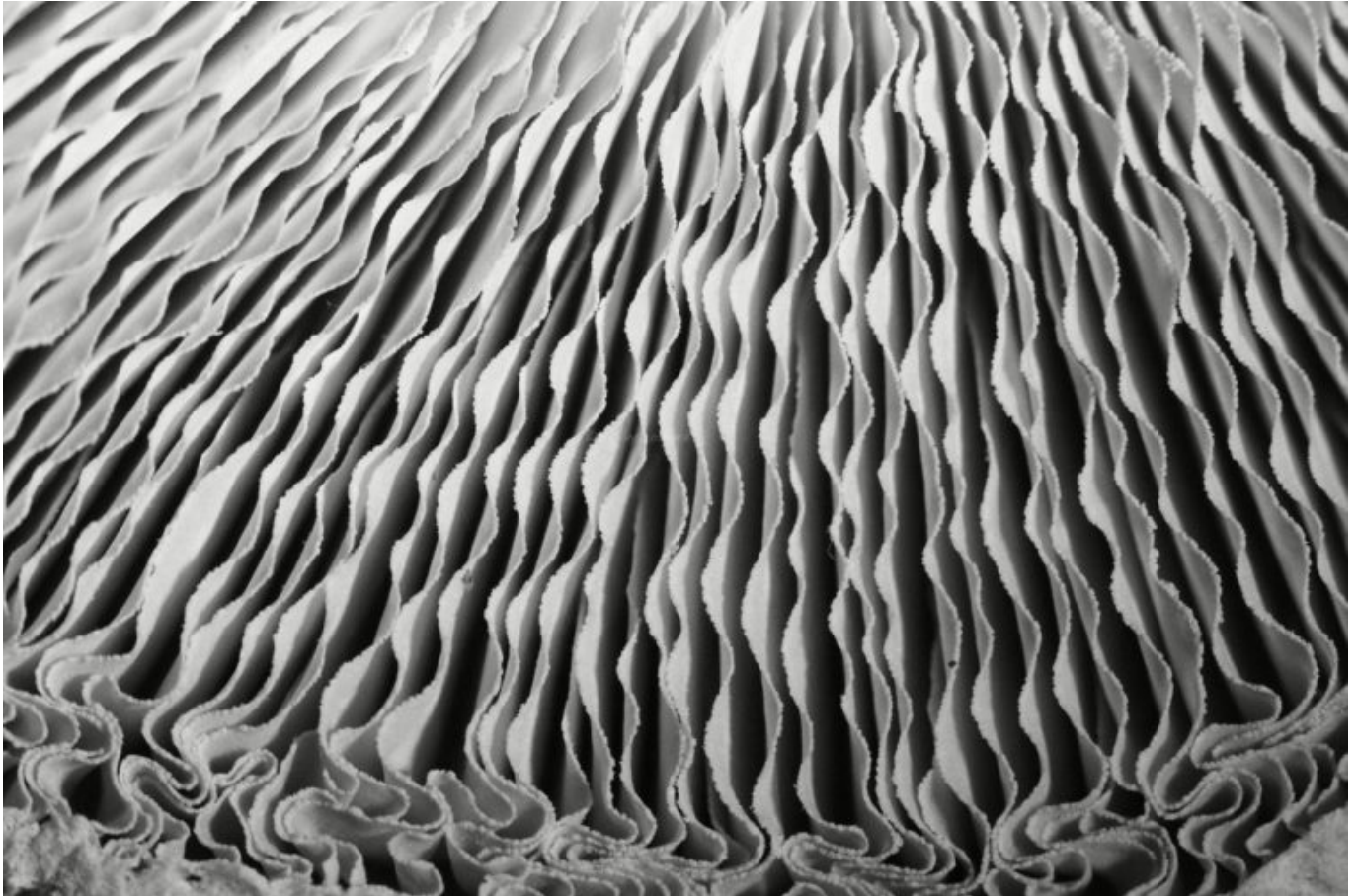
Edwige Lesiourd, artiste photographe, Invisible Nature https://www.edwigelesiourd.com/