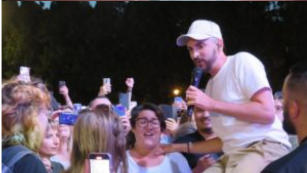
La Petite Culotte a fait chanter les 30 000 spectateurs avec « La goffa lolita », un des tubes de l'année 2022.