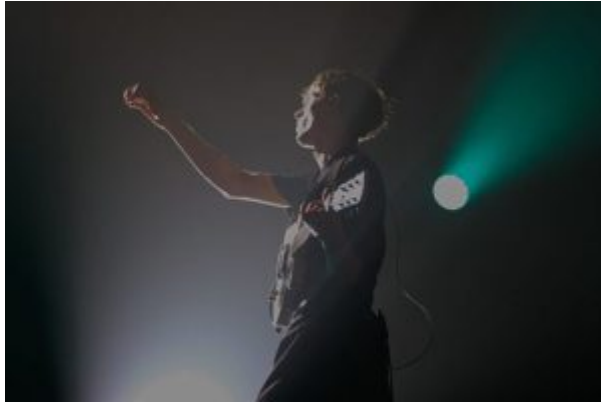
Ibeyi , groupe formé des sœurs jumelles Lisa-Kaindé et Naomi Díaz.