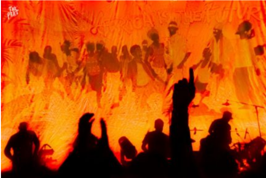
Roméo Elvis, rappeur belge.