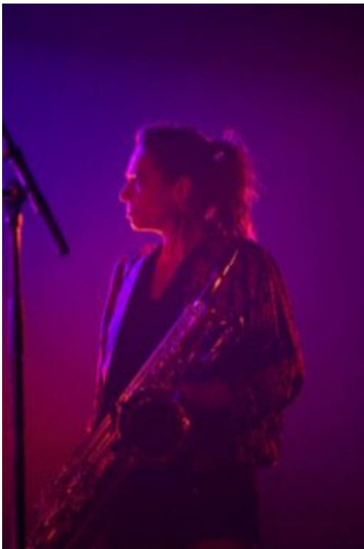
Kind Of Guru