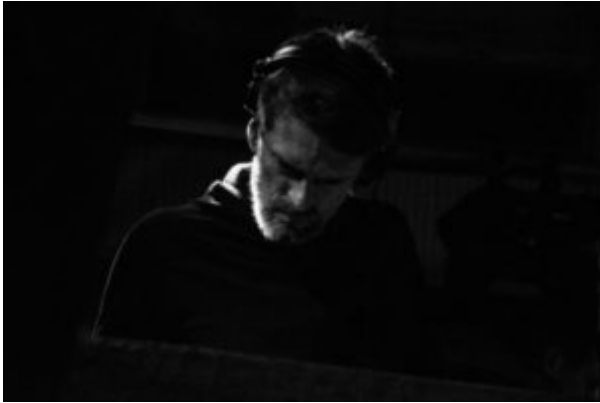
Manu le Malin.