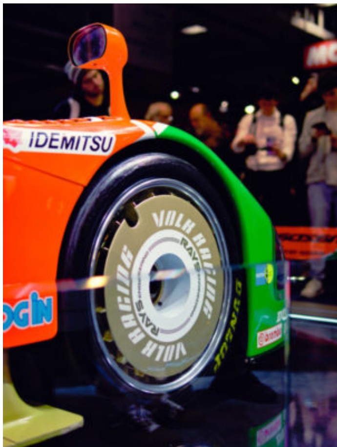
Une réplique de la voiture est visible au Musée des 24 Heures du Mans