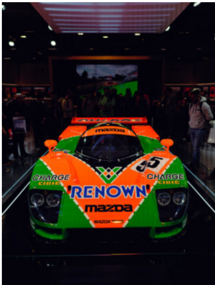
En 1991, la voiture japonaise s'était imposée au Mans