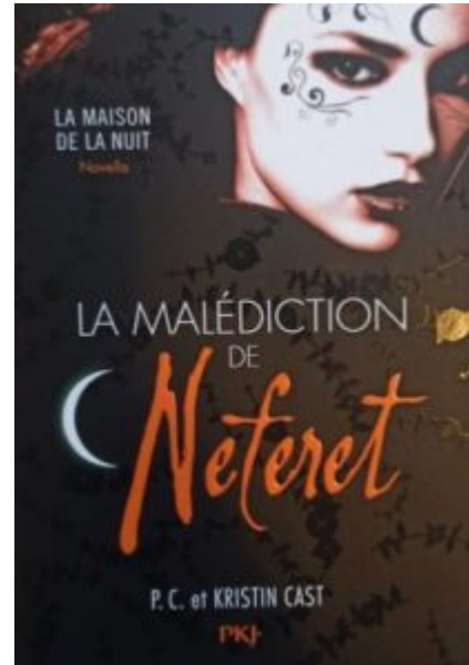
La malédiction de Neferet, un des hors série.

La saga est aujourd'hui terminée, avec 12 tomes publiés. Et bien qu'ils soient agréable à lire, certains passages traînent en longueur et donnent l'impression que l'œuvre part dans tous les sens sans qu'il n'y ait réellement de lien entre les actions.