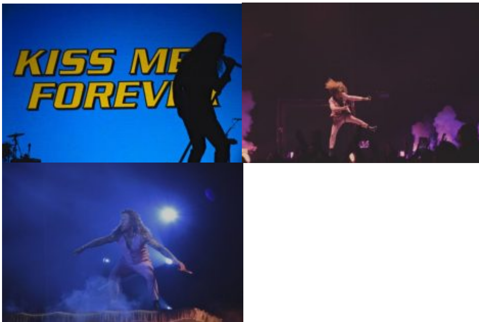
Un public survolté en adéquation avec le showman.