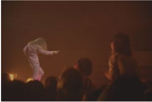
Une mise en scène surprenante et des décors étincelants.