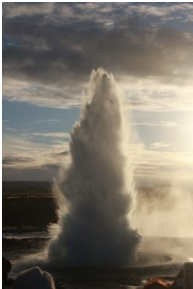
Geyser de Strokkur