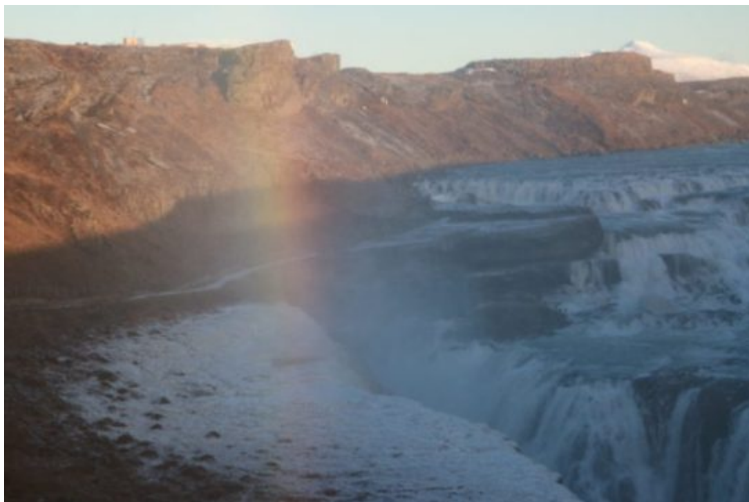
Cascade de Gullfoss