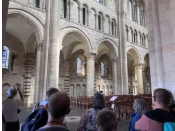
Arcs de la Cathédrale