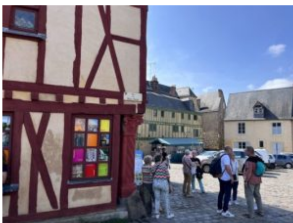
Lieu de rendez-vous

En 1134 et 1137, deux incendies détruisent l'église et obligent une reconstruction avec, cette fois-ci, un style plus gothique avec des arcs romans pour surélever le monument à 24 mètres de haut. Son point culminant atteint d'ailleurs les 34 mètres de haut.