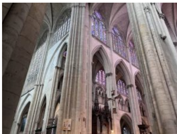
Intérieur de la Cathédrale