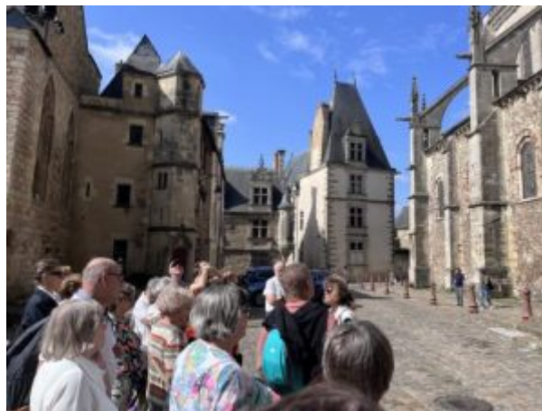
Extérieur de la Cathédrale

Ce petit périple se termine par différentes explications sur l'extérieur de la Cathédrale, longue de 136 mètres. Entre peintures, sculptures, statuts, vitraux et histoire, cette visite flash met en avant ce beau monument.