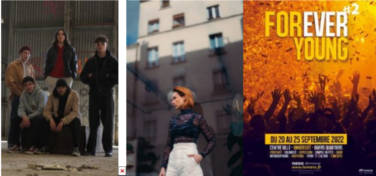
Still, Youv Dee et Suzane joueront le 24 septembre.