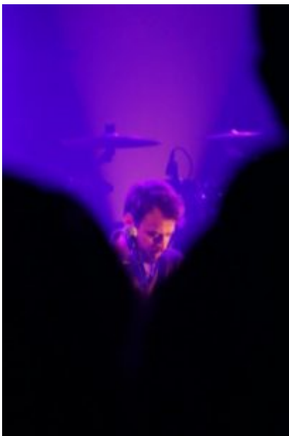
La première partie de Jason Mist

Tête d'affiche de cette première date du Bebop Festival 2022, Fatoumata Diawara, accompagnée de quatre musiciens, a partagé de bonnes vibrations musicales et livré des messages humanistes.