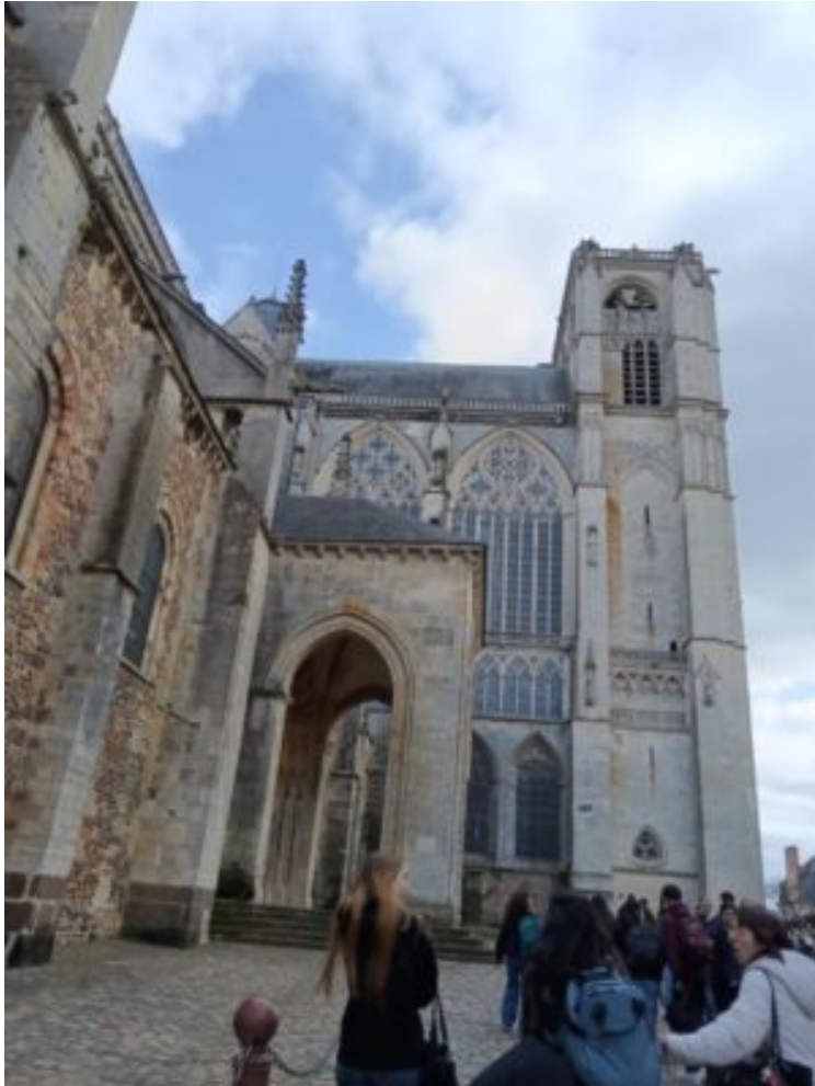
Visite de Monument Historique