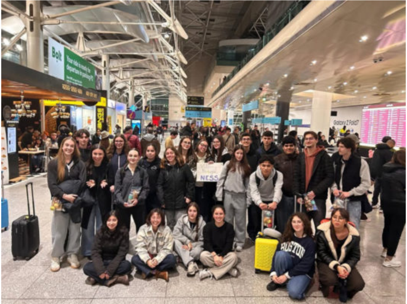
La Promotion ERASMUS 2026