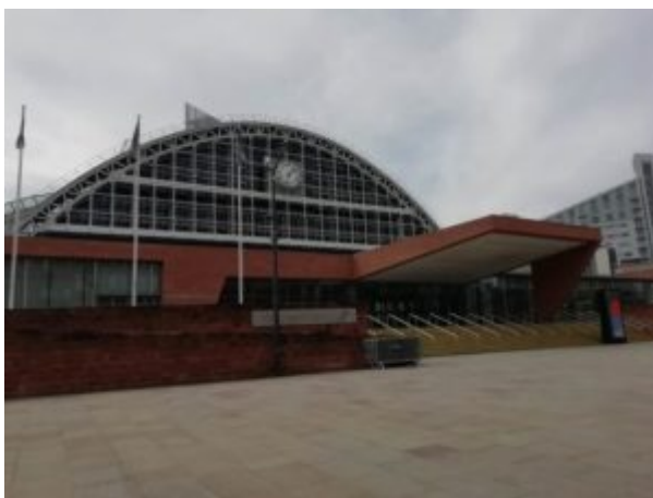
Le Manchester Central, une ancienne gare, a été transformée en Palais des congrès où se

Beaucoup de logements ou de bureaux ont été construit dans d'anciennes usines.