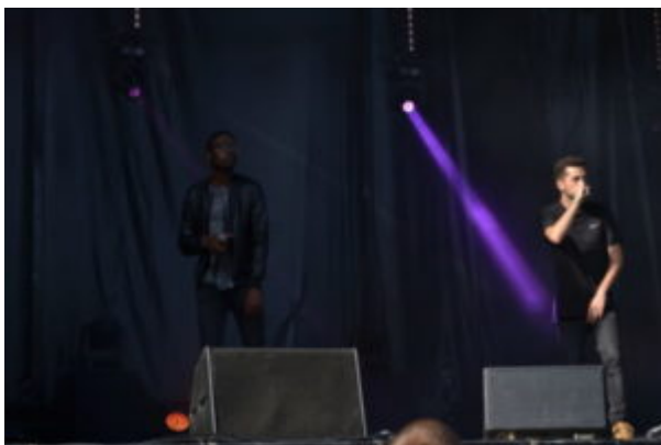
Diexa lors de son passage au Forum Jeunes 2017.