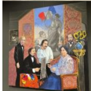
George Sand dans l'atelier de Delacroix avec Musset, Balzac et Chopin, 2004, 146×146 cm – acryle sur toile et collages.