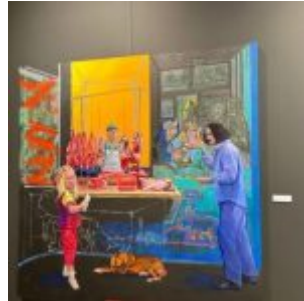
Cómo?... Don Diego decorando la carnicería a la manera de Don Pablo, 2005, 146 x 146 cm - Acrylique sur toile.