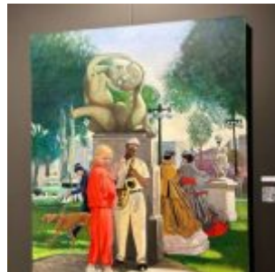
Solo, 2000, 162 x 130 cm - Acrylique sur toile.

Ce sont des références à ces artistes célèbres et à bien d'autres que l'on peut voir dans les peintures d'Herman Braun-Vega. Par exemple, La Baigneuse Valpinçon de Jean-Auguste Ingres et L'enlèvement des Sabines de Nicolas Poussin dans La chair du sectarisme ; ou La liberté guidant le peuple de Eugène Delacroix dans George Sand dans l'atelier de Delacroix avec Musset, Balzac et Chopin.