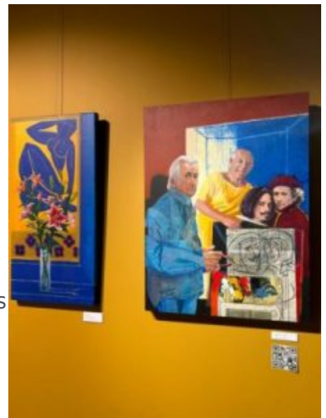
Autoportrait en famille, 2012, 60x80 cm.

Herman Braun-Vega se caractérise par un syncrétisme* culturel dans son œuvre, combinant des références artistiques classiques avec des éléments latino-américains contemporains. Sa carrière artistique, qui a débuté dans les années 1970, s'est concentrée sur la création de portraits, notamment de personnalités artistiques et littéraires, explorant une variété de techniques et de styles. Son engagement politique transparaît dans ses œuvres mettant en lumière les falsifications et les problèmes sociaux. L'interpicturalité, l'usage de citations picturales , est devenue une caractéristique majeure de son travail, faisant de lui un maître dans l'exploration des liens entre passé artistique et réalité