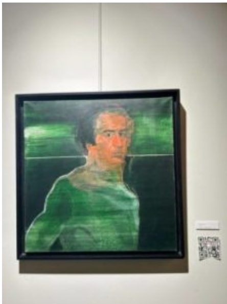
Autoportrait, 1970, 60x60 cm.

Le Centre d'art FIAA, au Mans, accueille depuis le 12 janvier 2024 l'exposition d'Herman Braun-Vega, un artiste peintre franco-péruvien. Cette série offre un aperçu unique de l'œuvre de l'un des artistes les plus importants de ces dernières décennies.