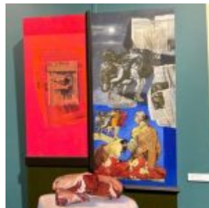
La chair du sectarisme, 2012, 80×60 cm – acrylique sur bois.