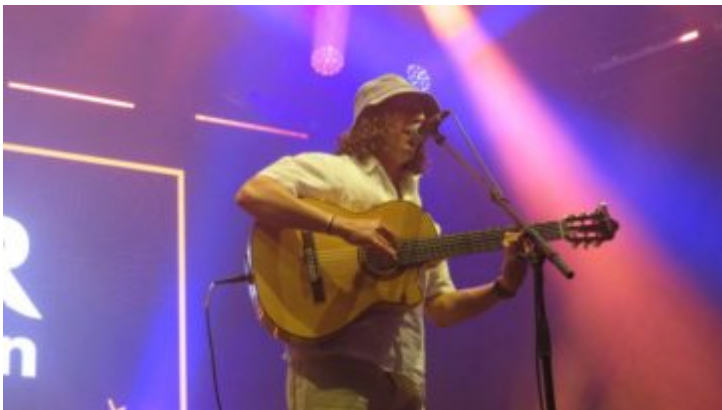
La Petite Culotte.

« C'est une belle émotion de voir le bonheur sur le visage des spectateurs. A force de persévérance, nous avons su créer une véritable alchimie avec le public. Et cette année, les planètes se sont alignées, entre la qualité du plateau et de bonnes conditions météo » (Jean-Éric