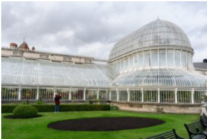
Botanic Belfast Garden