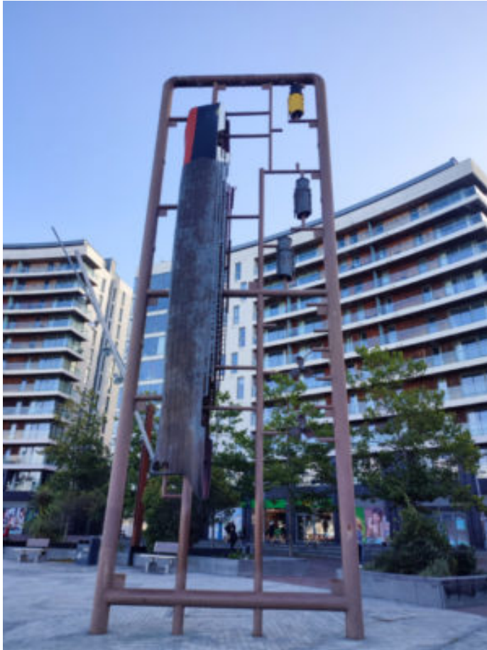
The city of the Titanic