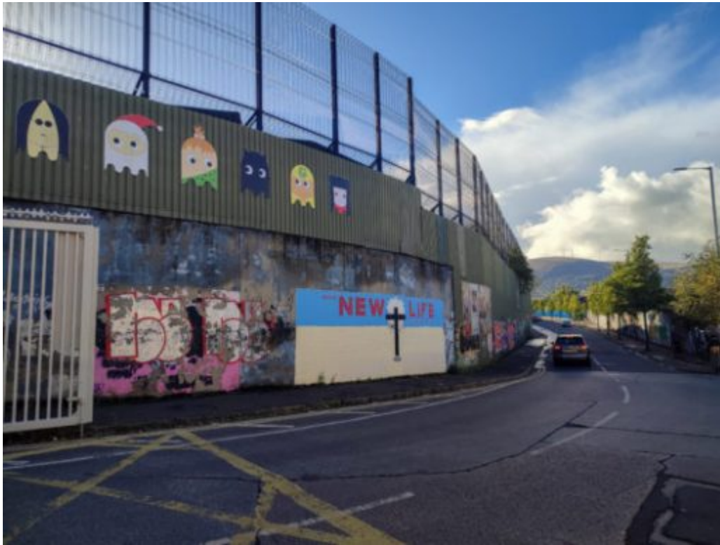
Wall of peace