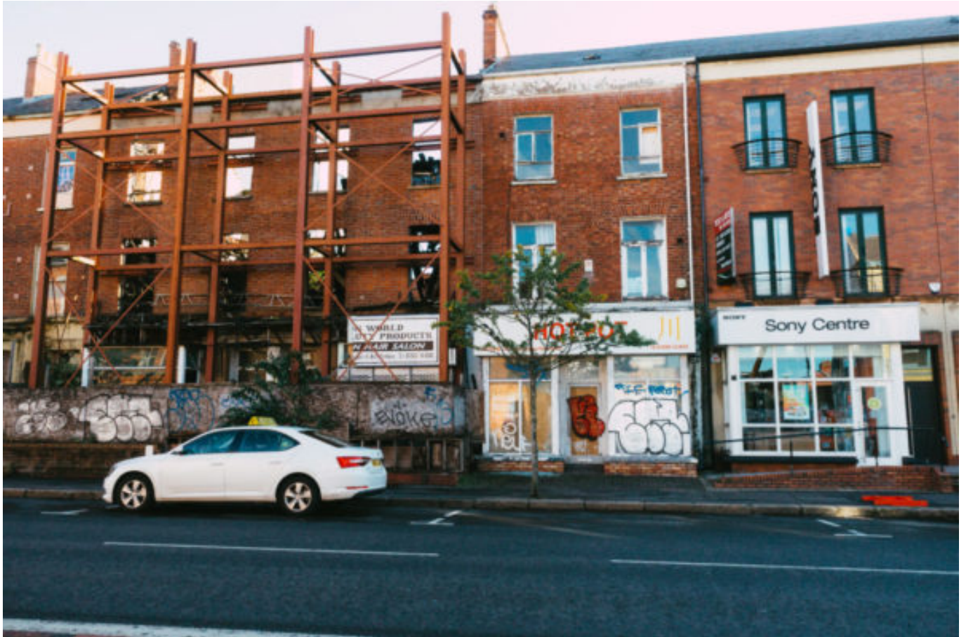
an empty street