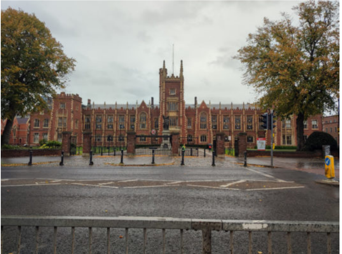
University Queen's Belfast