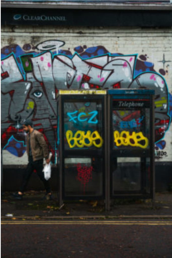
Graph in the street