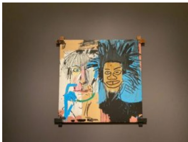
Dos Cabezas, 1982, Jean-Michel Basquiat.