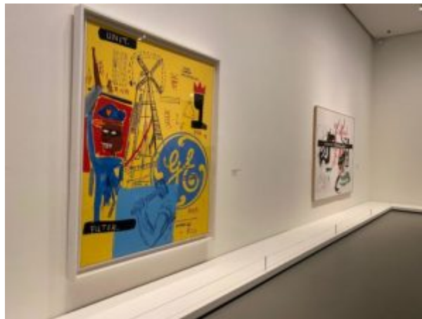
Untitled (General Electric II) , 1984 - 1985, Jean-Michel Basquiat et Andy Warhol

Depuis le 5 avril 2023, la Fondation Louis Vuitton accueille l'exposition temporaire Basquiat x Warhol. Une belle occasion pour découvrir les travaux résultant d'une fourmillante collaboration entre les peintres Andy Warhol et Jean-Michel Basquiat dans les années 80. Quelque 300 pièces, entre tableaux, sculptures et photographies, sont exposées.