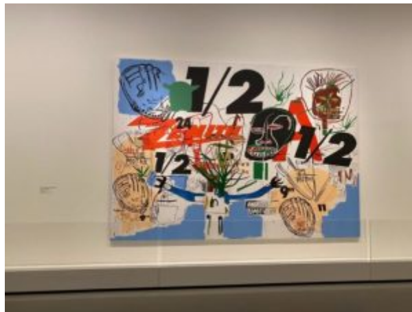
Untitled, 1984, Jean-Michel Basquiat, Andy Warhol.

l'un après l'autre dans des « allers-retours » productifs, et mettant en application ce qu'avait déclaré le jeune artiste américain, décédé à seulement 27 ans : « Andy commençait la plupart des peintures. Il mettait quelque chose de très reconnaissable, le logo d'une marque, et d'une certaine façon je le défigurais. Ensuite, j'essayais de le faire revenir, je voulais qu'il peigne encore. »