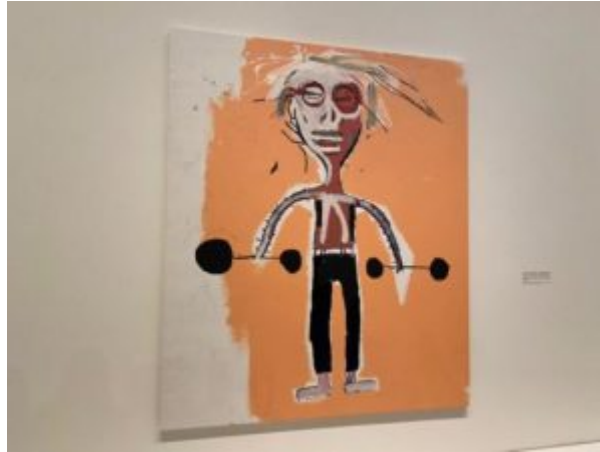
Untitled 1984, Jean-Michel Basquiat.