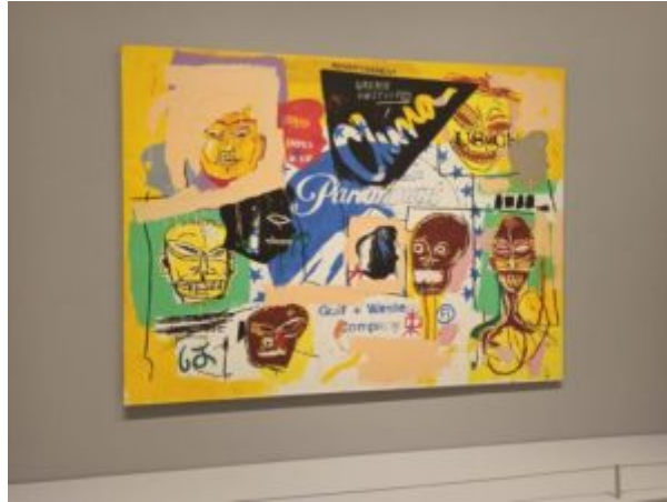
Paramount, 1984, Jean-Michel Basquiat, Andy Warhol.

Des productions plus originales comme celles peintes en trio avec Francesco Clemente sont également visibles. L'artiste italien a participé à une quinzaine d'œuvres en association avec Andy Warhol et Jean-Michel Basquiat.