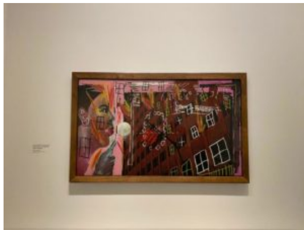
Premonition, 1984, Jean-Michel Basquiat, Andy Warhol, Francesco Clemente.