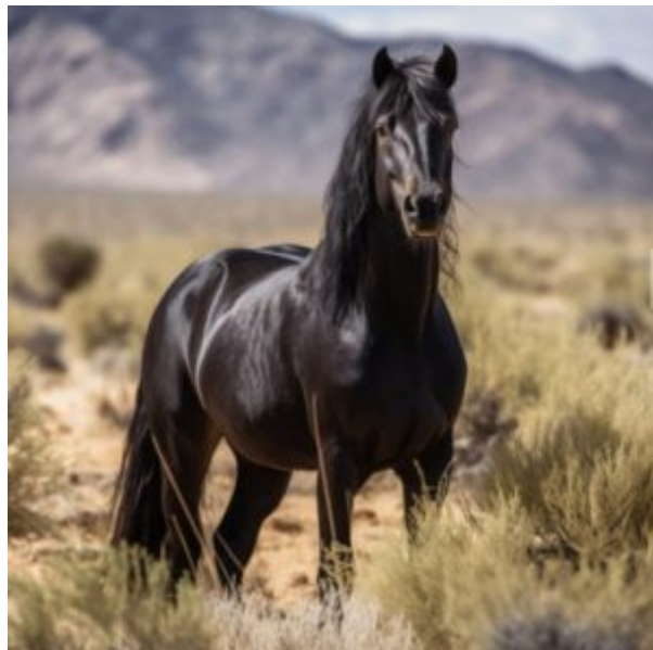
Commander, mustang noir ayant de l'importance pour Pauline