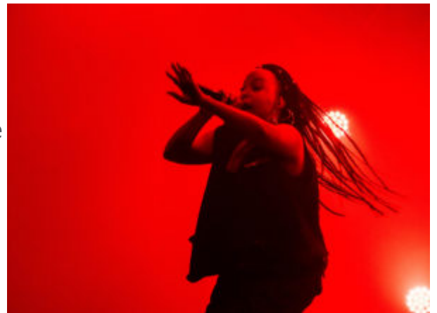
Dope Saint Jude.

Le groupe Deluxe a clos la soirée. Le public a apprécié la mise en scène monumentale, les costumes extravagants et colorés et les jeux de lumière sublimes. Dans une ambiance de folie, le groupe électro-pop aixois a donné le sourire aux lèvres de bout en bout.